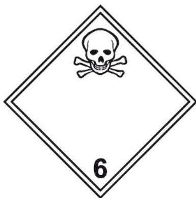
Rótulo Peligro Principal