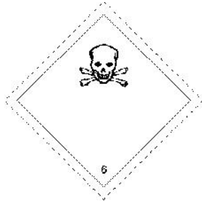
Rótulo Peligro Principal